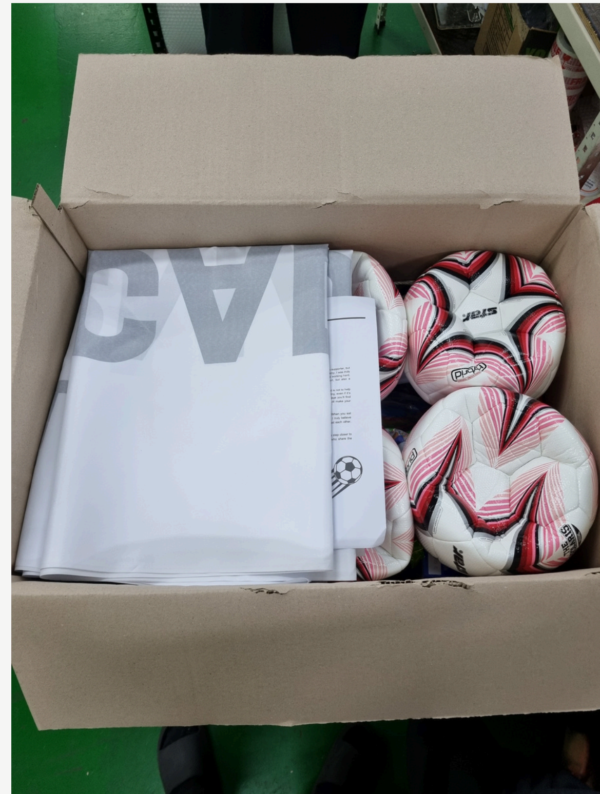
배송 준비 완료