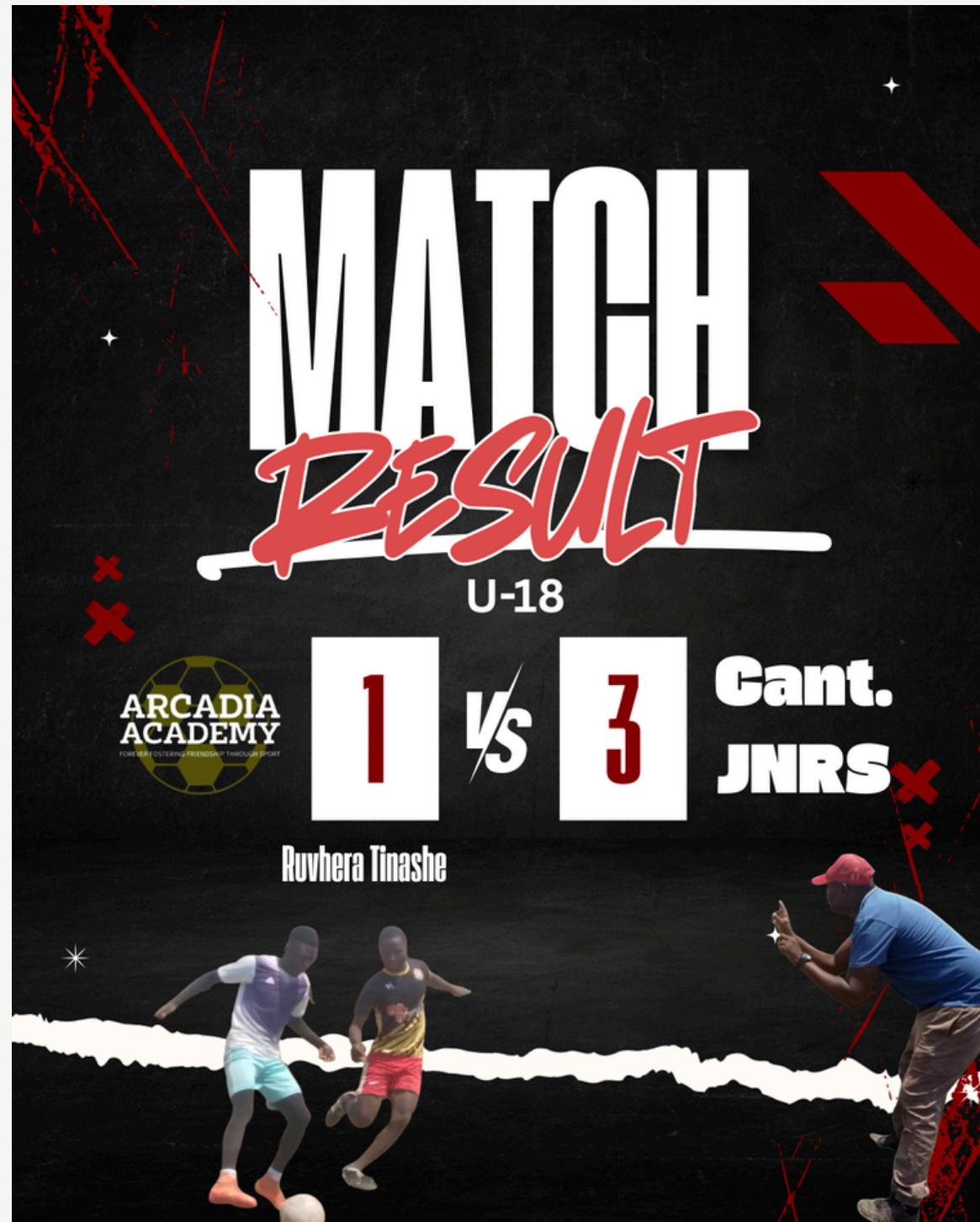
팀 홍보용 인스타그램 게시물