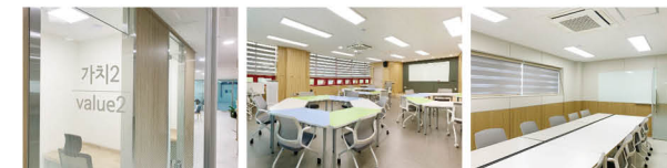
개인 오피스 시민력(교육장) 연결(회의실)

설립일 2022. 4. 27. 주소 성남시 수정구 수정로 185, 대동빌딩(3층) 대표전화 031)750-1444 홈페이지 www.seongnam.go.kr/snsimin 주요사업 공익활동 아카이빙, 공익활동 상담소, 시민사회 공론장, 공익활동 의제 시민모임, 단체운영 역량강화, 공익활동 워크숍 시설현황 (대관신청) 홈페이지 대관안내 - 대관신청