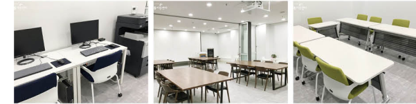
누구나터 와글와글터 작당터