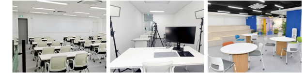
채움터 키움터 공유오피스