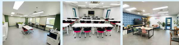
공유사무실 대화의실 오픈카페

설립일 2022. 11. 21. 주소 의정부시 추동로 140 경기북부상공회의소 2층 대표전화 031)853-9766 주요사업 비영리스타트업, 공익활동가 성장지원, 공익활동 상담소